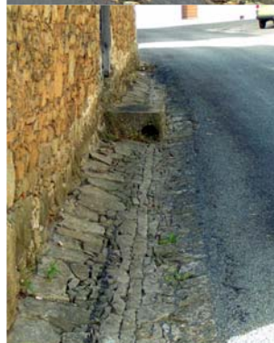
Caniveau en opus incertum Bourg de Royères