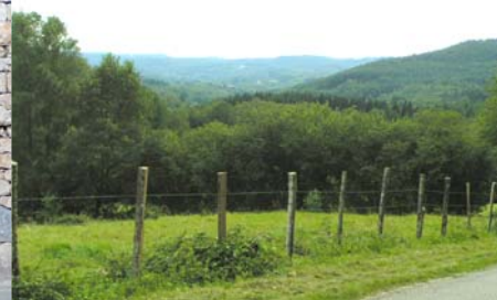
Clôture - Nedde, abords du bourg