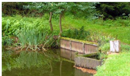
Étang - Moissannes