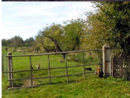
Clôture - Saint-Léonard-de-Noblat, Chigot