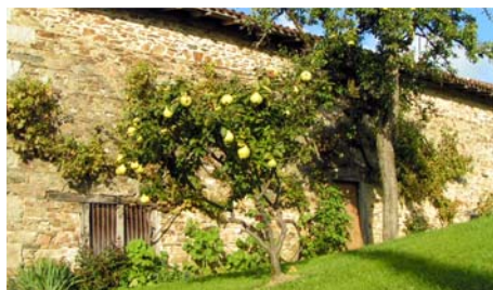
Treille - Bourg d'Eybouleuf