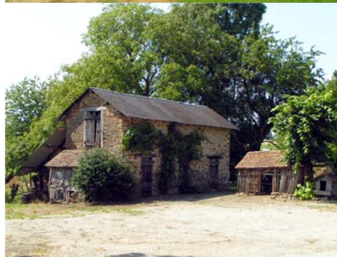
Cours - Linards, Le Burg