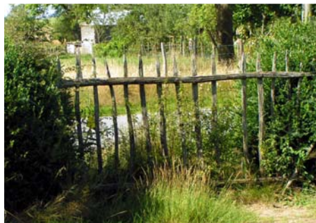
Clôture - Linards, Les Courbes

Les haies arbustives mêlent souvent différentes essences et se développent davantage en épaisseur. De grands arbres de haut-jet (frênes, ormes, chênes, charmes, châtaigniers, noyers...) peuvent accompagner les arbustes (saules, aulnes, noisetiers, ajoncs, viornes, troènes, sureaux, genêts, fusains, aubépines, buis, cornouillers, prunelliers, chèvrefeuilles...).