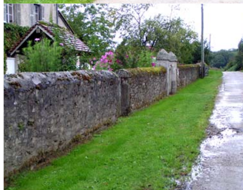
Cheminement - Moissannes, Levaud-Fernand