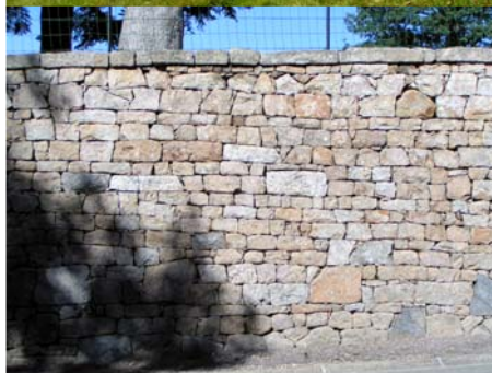
Clôture - Bourg de Nedde