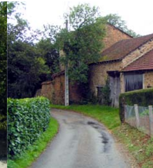
Cheminement - Saint-Julien-le-Petit, Barbaroux