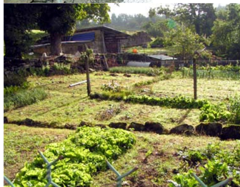
Potager - Beaumont-du-Lac, Villemoujane