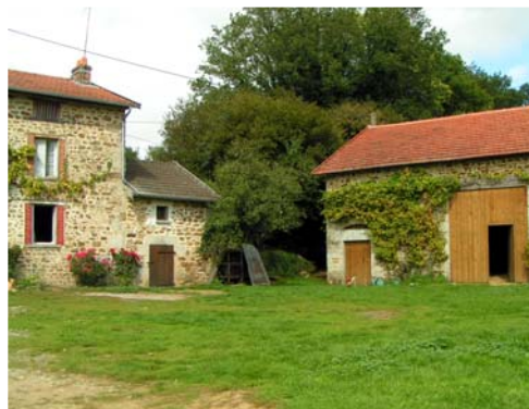
Cours - Champnétery, La Joubertie

Il est fréquent de trouver les pieds des murs traités en moellons : caniveaux appareillés en pavés ou plus souvent en moellons au tout-venant d'opus incertum. La plupart des toits n'ayant pas de gouttière, ces caniveaux facilitaient l'écoulement des eaux, et asseyaient la construction de manière plus finie et esthétique.