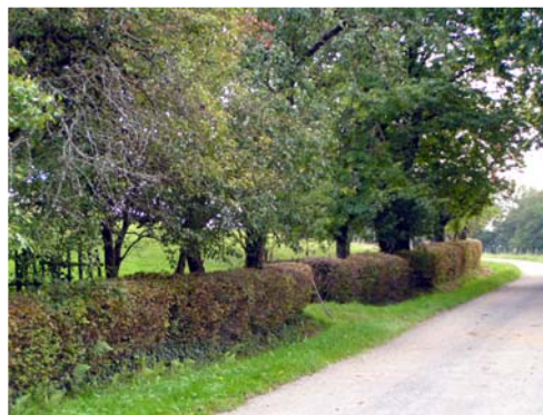
Cheminement - Eybouleuf, Les Vergnes

Les routes menant aux bourgs et villages sont parfois plantées d'allées d'arbres (hêtres, chênes, châtaigniers...). Ces allées marquent parfois aussi les accès aux fermes (tilleuls, pommiers...) ou plus souvent aux domaines et châteaux (épicéas, chênes, hêtres...).