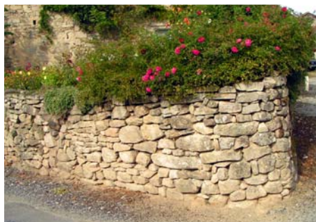
Clôture - La Geneytouse, Les Allois

Certaines haies, plus rares, se limitent à une essence : châtaigniers, noisetiers..., complétées de clôtures en bois.