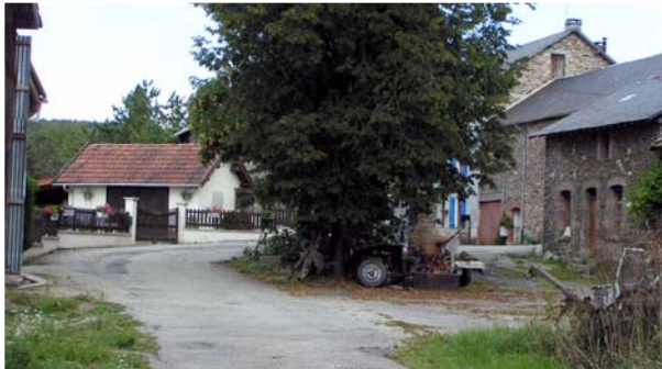
Place de village - Châteauneuf-la-Forêt, Serre

Les composantes de ces abords révèlent une grande richesse et une grande variété de traitement mais la simplicité et la sobriété prédominent toujours.