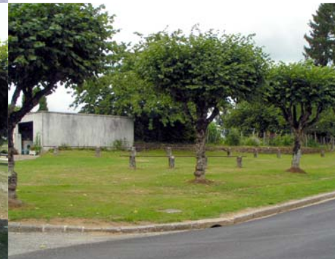
Place de village - Sussac, ancien marché à bestiaux