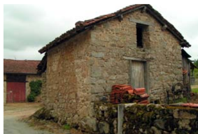
Four à pain-clédier - Roziers-Saint-Georges

cognassiers...), et de plusieurs formes :