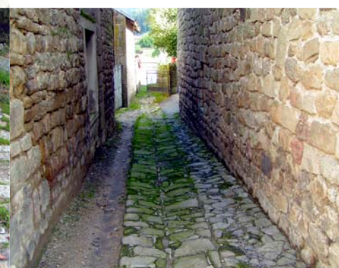
Sol - Bourg de Peyrat-le-Château