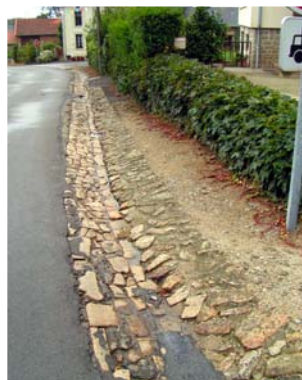
Caniveau en opus incertum Bourg de Moissannes