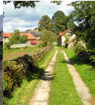
Cheminement - Peyrat-le-Château, Le Chalard-Haut