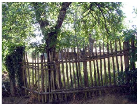
Clôture - Saint-Méard

En milieu rural, espaces public et privé se mêlent plus facilement, le végétal se prolongeant l'un dans l'autre. Dans les villages vers la montagne, il arrive que les exploitations s'entremêlent : les cours y sont rarement fermées.