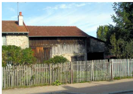
Clôture - Sauviat-sur-Vige