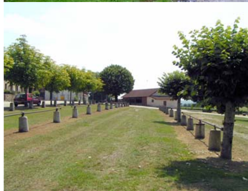
Place de village - bourg de Linards, mail