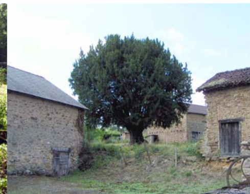
Arbre isolé - Châteauneuf-la-Forêt, Moussanas