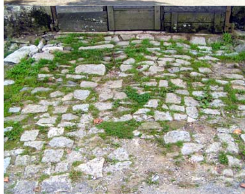
Sol - La Geneytouse, Le Châtain